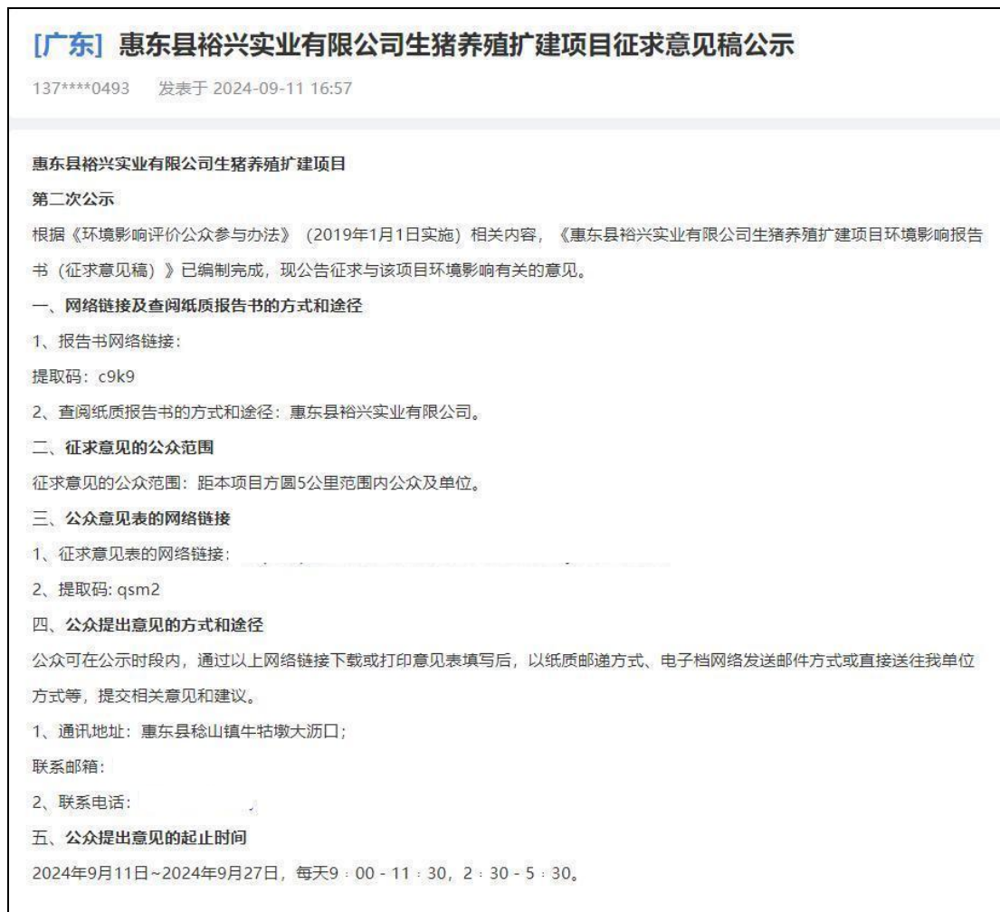
图 3.1-1 征求意见稿网络公示截图