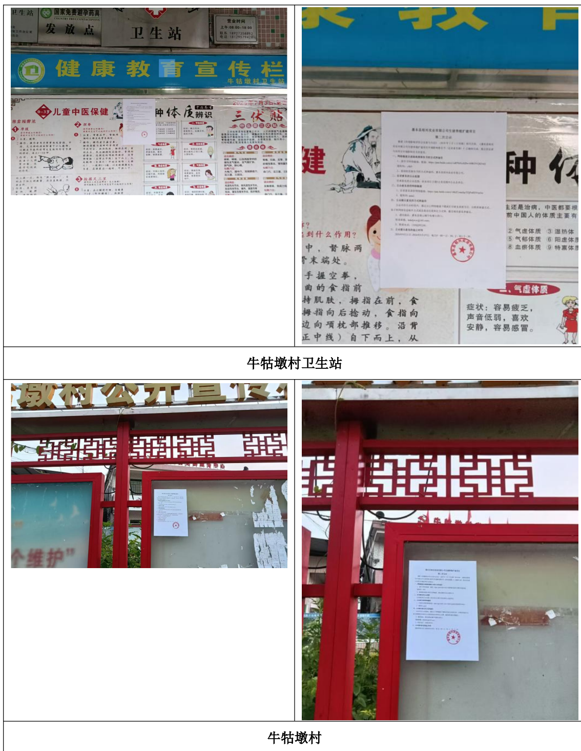
图 3.1-4 本项目征求意见稿环境影响评价信息张贴公示照片