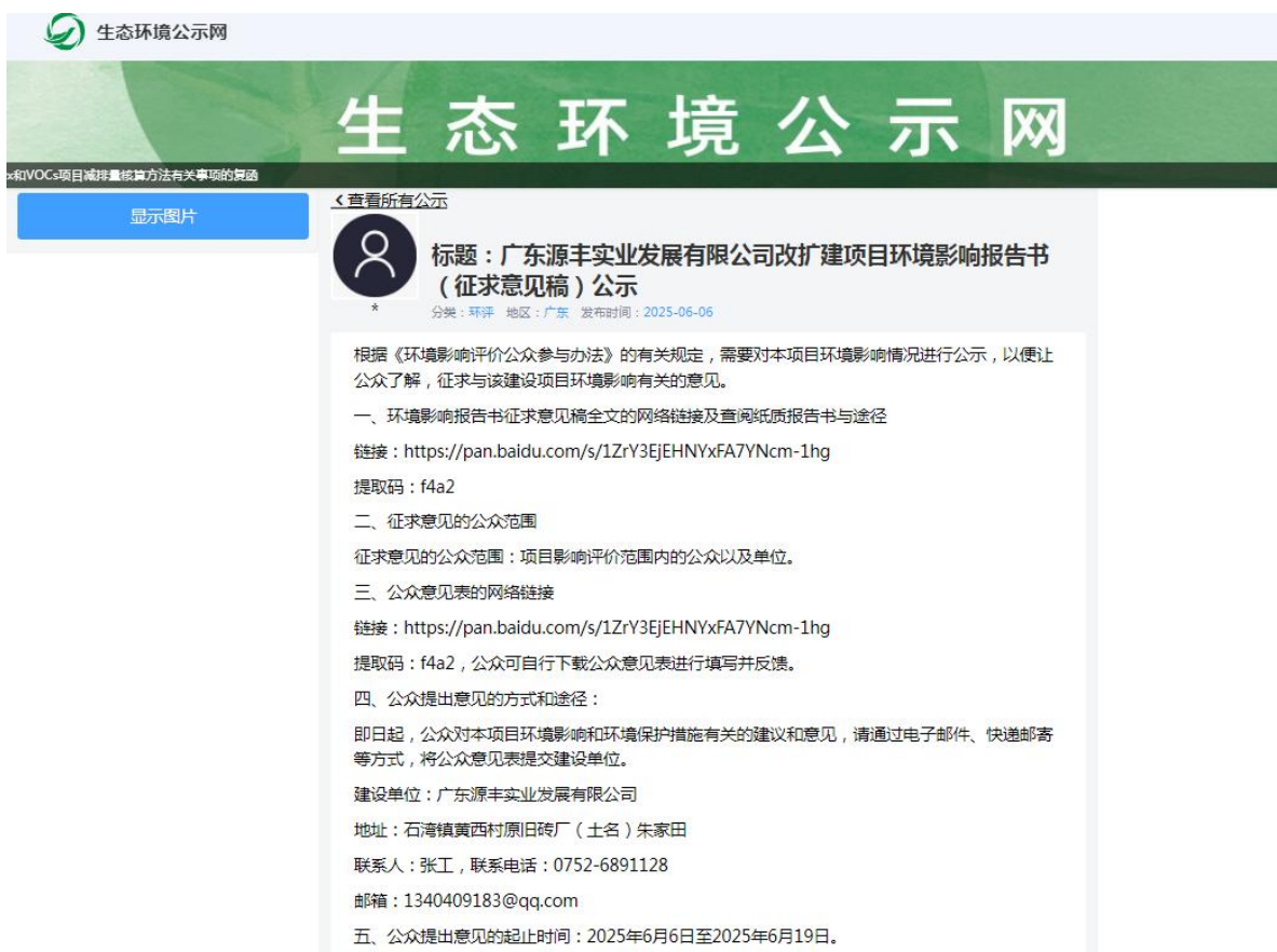
图 3.2-1 征求意见稿公示