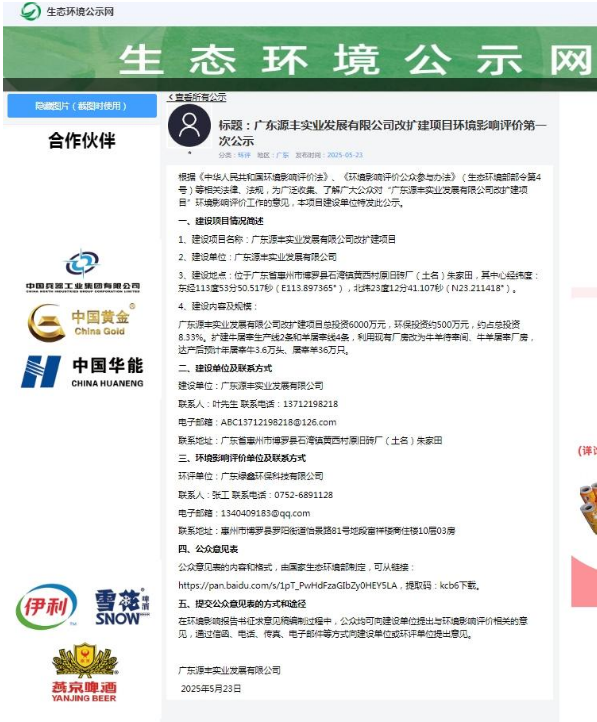
图 2.2-1 首次信息公开截图

网站公示链接地址： https://gongshi.qsyhbgj.com/h5public-detail?id=448474 。网站截图见下图。