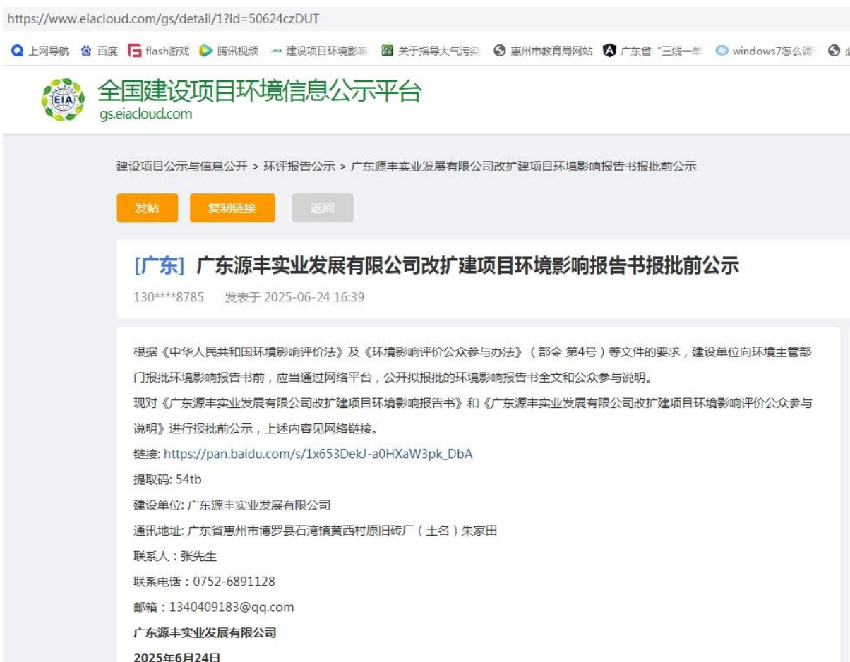
图 5-1 报批前公示截图